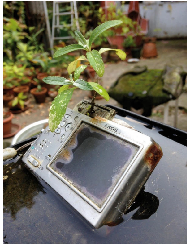
Pull over time de Michel Blazy