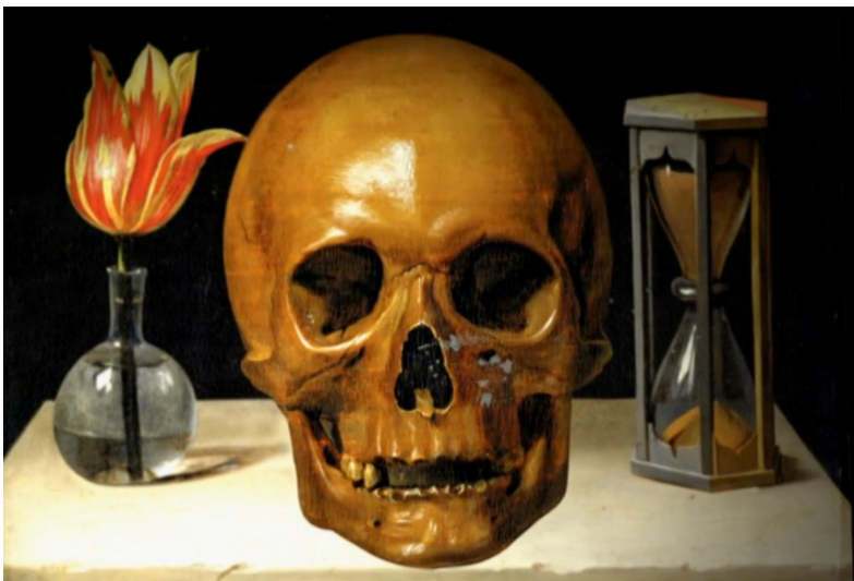
Philippe de Champaigne Vanité, ou Allégorie de la vie humaine première moitié du XVII e huile sur bois, 28 cm x 37 cm musée de Tessé, Le Mans